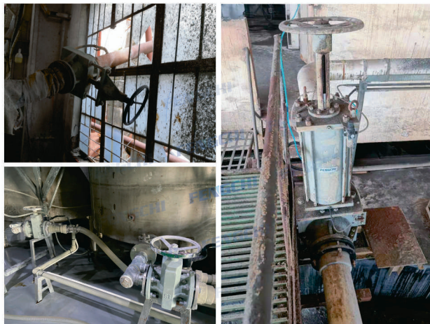
产品名称： 手动管夹阀 金矿项目现场 气动(配备手动机构)管夹阀 钛白粉项目现场