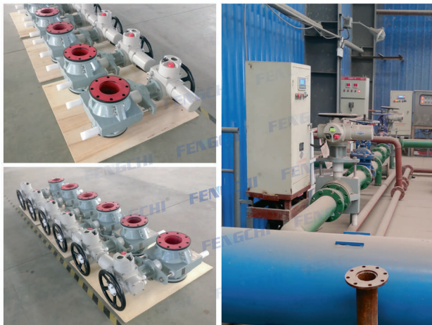
产品名称：DN150电动调节型管夹阀 相关材质：阀体铝合金、进口耐纳特天然橡胶 多回转智能调节型电动头、380V 铁矿尾矿充填项目